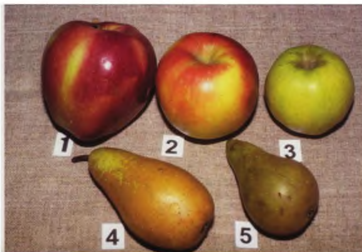
Яблоки и груши:

1 - 230 г, 2 - 170 г, 3 - 100 г, 4 - 120 г, 5 - 80 г.